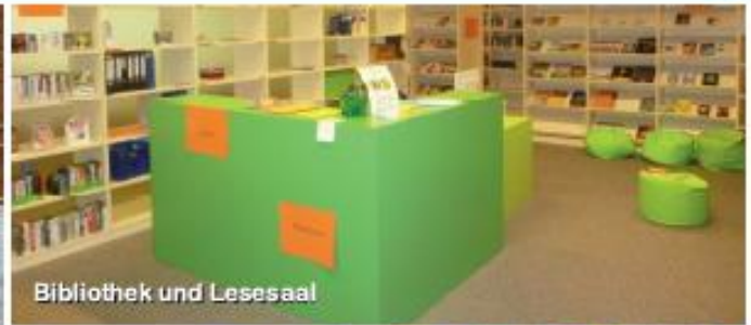
Bibliothek und Lesesaal