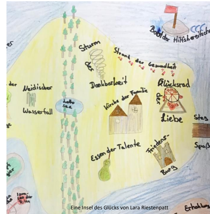
Eine Insel des Glücks von Lara Riestenpatt